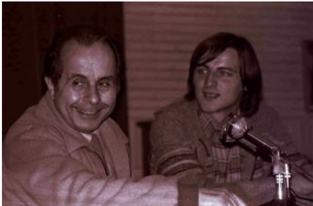
Piero Pasolini a un congresso Gen[/caption]