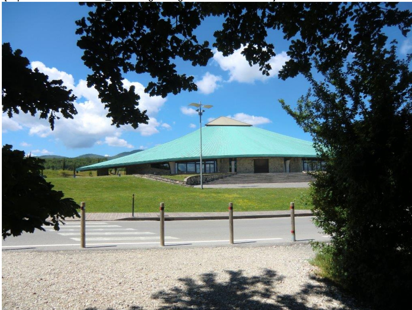
Santuario Maria Theotokos (Loppiano)[/caption]

[caption id="attachment_1507" align="aligncenter" width="750"]